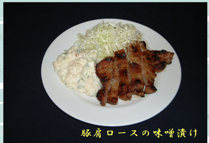
豚肩ロースの味噌漬け